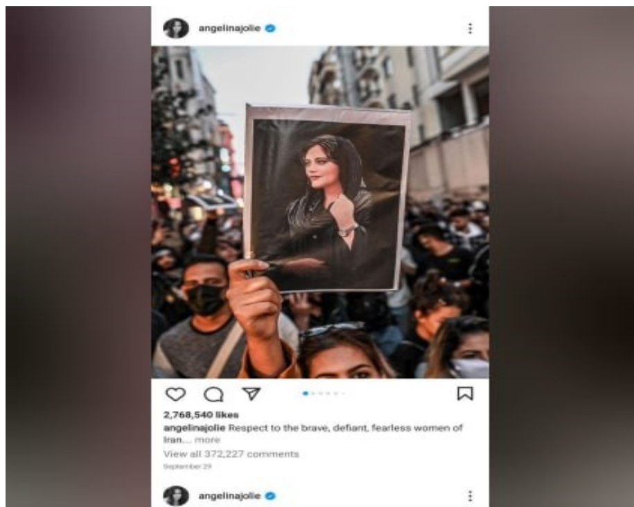
آنجلینا جولی و حمایت از اغتشاشات در ایران با اسم رمز مهسا

علاوه بر این، موضع‌گیری چهره‌های مشهور، حتی بازیگران پورن سینما و ستارگان هالیوود، ورزشکاران مطرح جهان، سیاست‌مداران کشورهای غربی، تشکیل زنجیره‌های انسانی در سراسر دنیا، را نیز شاهد بودیم. در واقع این بار، همه به صحنه آمدند.